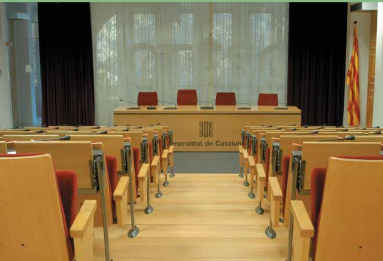
Visió de la Sala de Plens del Consell.